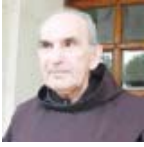
AT ZEF PLLUMI