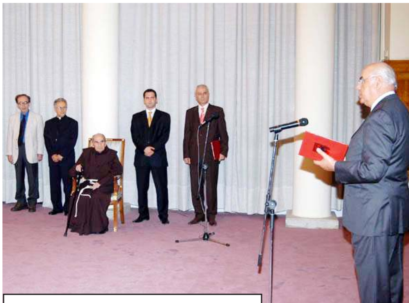
“Nder i Kombit”