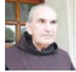
AT ZEF PLUMI