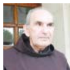
AT ZEF PLLUMI