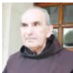
AT ZEF PLUMI